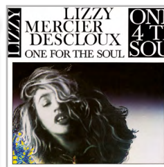
One For The Soul