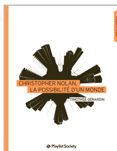
Christopher Nolan, la possibilité d'un monde