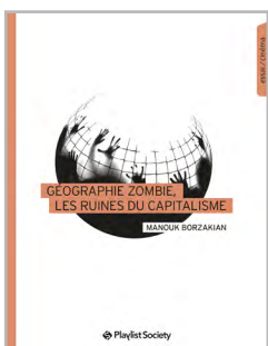
Géographie zombie, les ruines du capitalisme

Également chez Playlist Society - www.playlistsociety.fr