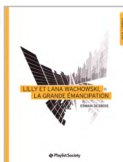
Lilly et Lana Wachowski, la grande émancipation