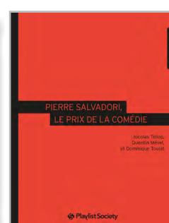
Pierre Salvadori, le prix de la comédie