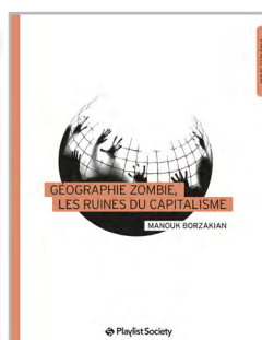
Géographie zombie, les ruines du capitalisme