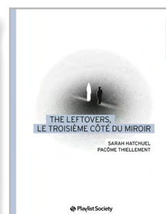
The Leftovers, le troisième côté du miroir