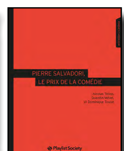
Pierre Salvadori, le prix de la comédie