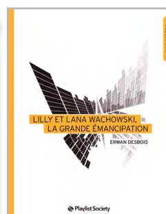
Lilly et Lana Wachowski, la grande émancipation