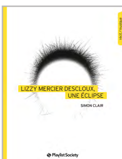
Lizzy Mercier Descloux, une éclipse

Également chez Playlist Society - www.playlistsociety.fr