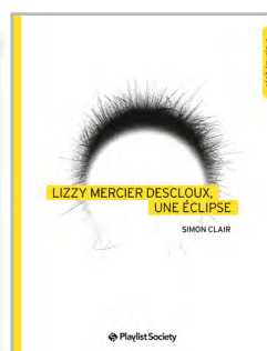
Lizzy Mercier Descloux, une éclipse