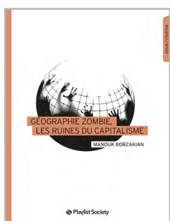
Géographie zombie, les ruines du capitalisme

Également chez Playlist Society - www.playlistsociety.fr