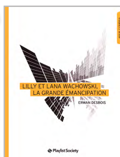
Lilly et Lana Wachowski, la grande émancipation