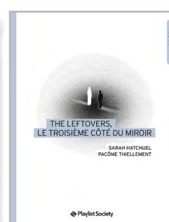
The Leftovers, le troisième côté du miroir