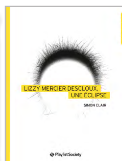
Lizzy Mercier Descloux, une éclipse