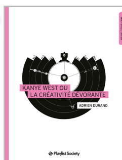
Kanye West ou la créativité dévorante