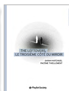
The Leftovers, le troisième côté du miroir