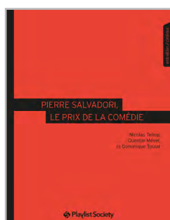
Pierre Salvadori, le prix de la comédie

Également chez Playlist Society - www.playlistsociety.fr