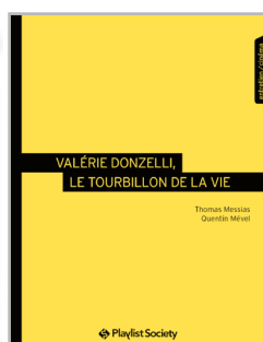
Valérie Donzelli, le tourbillon de la vie