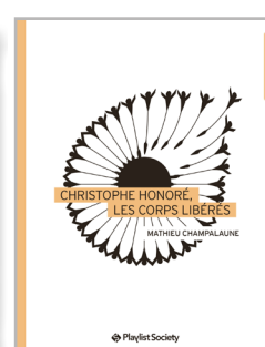
Christophe Honoré, les corps libérés