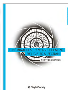
Cinémiracles, l'émerveillement religieux à l'écran