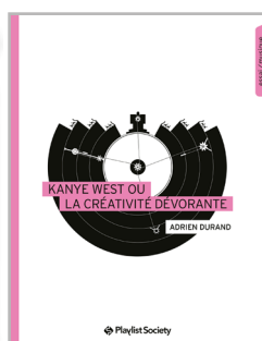
Kanye West ou la créativité dévorante