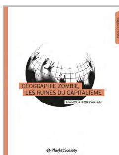
Géographie zombie, les ruines du capitalisme

Également chez Playlist Society - www.playlistsociety.fr