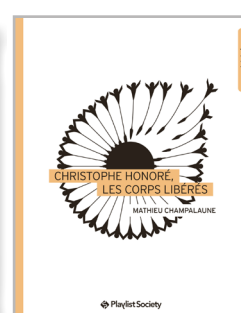
Christophe Honoré, les corps libérés