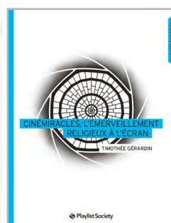
Cinémiracles, l'émerveillement religieux à l'écran