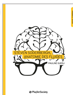
Steven Soderbergh, anatomie des fluides