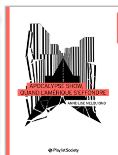
Apocalypse show, quand l'Amérique s'effondre