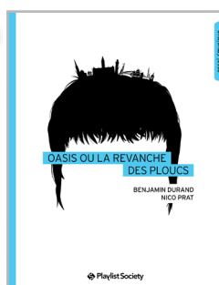
Oasis ou la revanche des ploucs