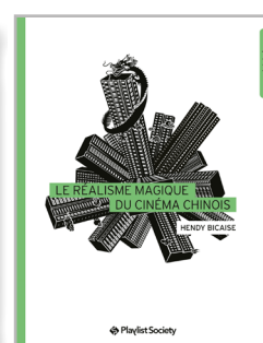
Le Réalisme magique du cinéma chinois