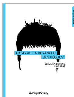
Oasis ou la revanche des ploucs