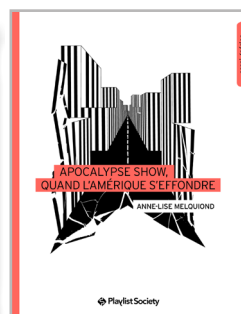
Apocalypse show, quand l'Amérique s'effondre