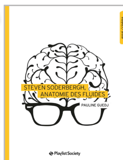
Steven Soderbergh, anatomie des fluides