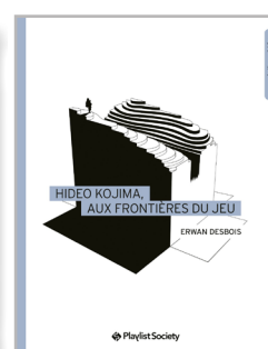
Hideo Kojima, aux frontières du jeu