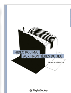
Hideo Kojima, aux frontières du jeu