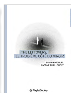
The Leftovers, le troisième côté du miroir