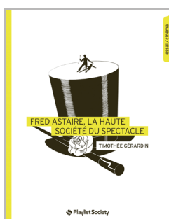
Fred Astaire, la haute société du spectacle

Également chez Playlist Society - www.playlistsociety.fr