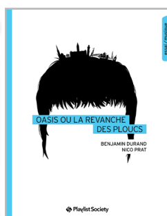
Oasis ou la revanche des ploucs