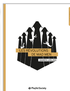
Les Révolutions de Mad Men