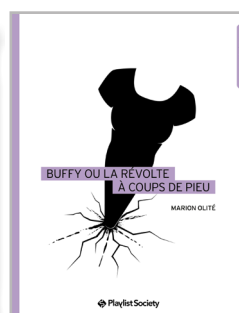
Buffy ou la révolte à coups de pieu