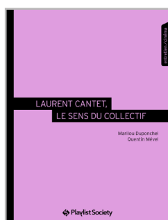
Laurent Cantet, le sens du collectif

Également chez Playlist Society dans la collection Face B - www.playlistsociety.fr