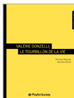
Valérie Donzelli, le tourbillon de la vie