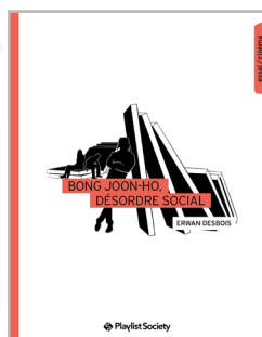
Bong Joon-ho, désordre social