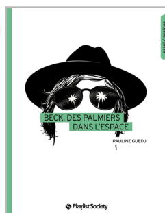
Beck, des palmiers dans l'espace