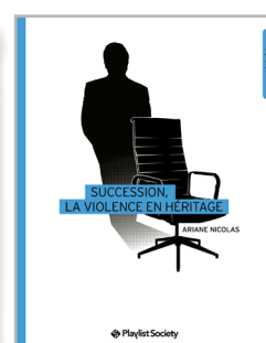
Succession, la violence en héritage