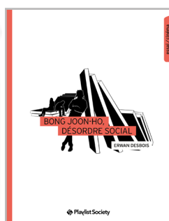
Bong Joon-ho, désordre social