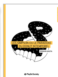
Les Simpson ou le paradoxe du donut intemporel